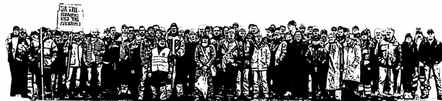
Ligne de piquetage à APM Terminals Göteborg, le 17 mai 2016

Le terminal à conteneurs de Göteborg, le plus grand de tous les pays nordiques, a connu des problèmes depuis que APM Terminals (APMT) a obtenu la concession. Des crises répétées ont conduit à une baisse spectaculaire des parts de marché, passant de 57% du marché des conteneurs suédois à 45% en quelques années.